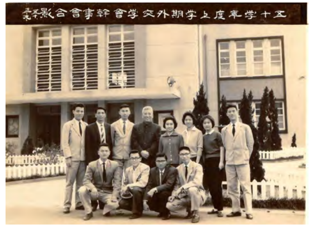
宋楚瑜主席大學時期與外交系學會幹事會成員合影

我們必須努力才有可能抓住機運，如同青年時期的宋主席，默默地為了理想耕耘。然而，機運也可以藉由自己的雙手打造，就像宋主席在台灣最艱困時「創造形勢」一樣，他說：「如果這條路走不通，就要思考換個方法，走出一條路。」不論是中華民國外交，或是面對人生的大小事都是如此，試著停下腳步，換個方式思考，或許能夠有意想不到的收穫。