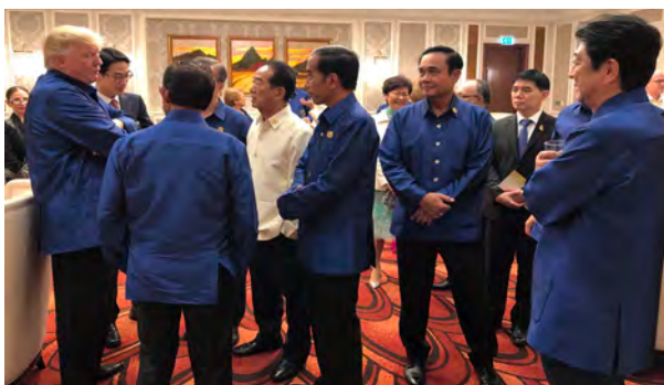
宋楚瑜主席與美國總統川普及其他國家元首相談甚歡的情景

先生的秘書，本已通過特考要到外交部工作，後卻因為中華民國與美國斷交，而接任新聞局代理局長，因此與外交部擦身而過。儘管沒有進過外交部亦沒有正式當過外交官，宋主席做的事情從來沒有離開過外交，四任總統都曾派他為「特使」，公開或私下進行外交任務。例如，在一九八〇年宋主席便曾帶著經國先生親簽信函會見雷根總統，傳達希望美國政府售台 F-16 軍機的建議。此外，一九九二年宋主席在擔任國民黨秘書長時也帶著李登輝總統的親簽信函密訪美國老布希政府，拜會副總統奎爾，表達台灣安全對戰機的軟性訴求，成功達成使命。而在二〇一七年與二〇一八年亦兩度代表參加「APEC 經濟領袖高峰會議」，仍然把握出席國際會議的機會，為台灣發聲，爭取能見度。