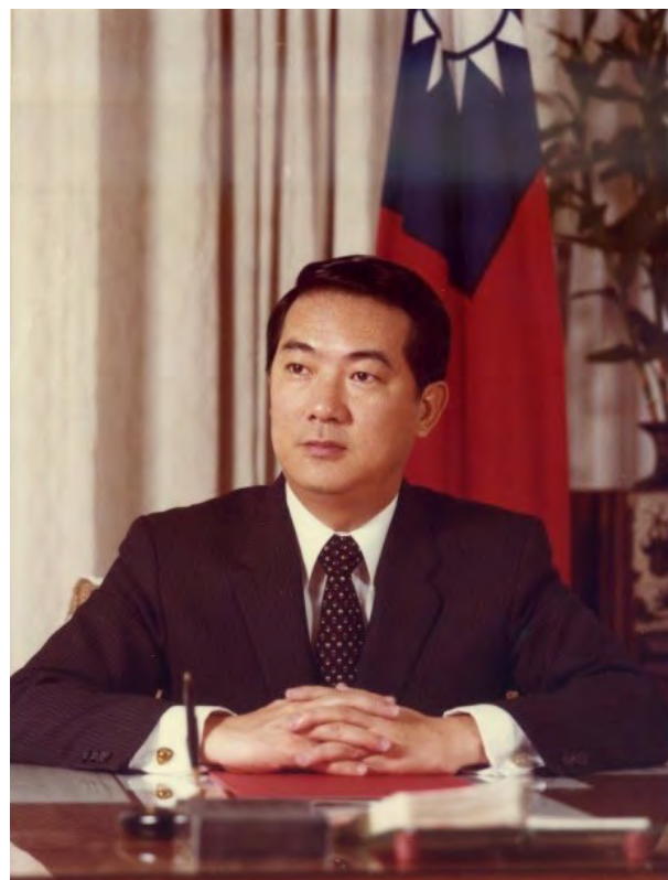
宋楚瑜主席擔任新聞局局長時的帥氣照片

先生的秘書，本已通過特考要到外交部工作，後卻因為中華民國與美國斷交，而接任新聞局代理局長，因此與外交部擦身而過。儘管沒有進過外交部亦沒有正式當過外交官，宋主席做的事情從來沒有離開過外交，四任總統都曾派他為「特使」，公開或私下進行外交任務。例如，在一九八〇年宋主席便曾帶著經國先生親簽信函會見雷根總統，傳達希望美國政府售台 F-16 軍機的建議。此外，一九九二年宋主席在擔任國民黨秘書長時也帶著李登輝總統的親簽信函密訪美國老布希政府，拜會副總統奎爾，表達台灣安全對戰機的軟性訴求，成功達成使命。而在二〇一七年與二〇一八年亦兩度代表參加「APEC 經濟領袖高峰會議」，仍然把握出席國際會議的機會，為台灣發聲，爭取能見度。