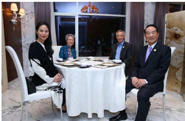
宋楚瑜主席與女兒宋鎮邁和新加坡總理李光耀夫婦茶敘